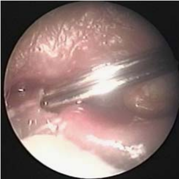
Figure 1. The photograph of putting two probes in the left lower canalculus.

술 후 항생제와 스테로이드 점안액을 하루 4회 점안하였고 스테로이드 분무제를 하루 2회 비강 내에 분무하였으며 생리식염수 비강 세척기를 이용하여 하루 3회 정도 비강세척을 하도록 교육하였다. 술 후 1일째 비강 내 합성스폰지를 제거하였으며 경과관찰은 특별한 문제가 없을 경우 1주 간격으로 1~2회, 2주 간격으로 1~2회, 1개월 간격으로 1~2회, 그 후 2~3개월 간격으로 이루어졌으며 내원시마다 누도 관류검사를 시행하여 개통 여부를 확인하였으며 이비인후과 진료를 보고 비강 내 상태를 점검 받도록 하였다. 실리콘 관의 제거는 술 후 5개월 쯤 시행하였으며 내시경을 이용하여 비강 안에서 이루어졌다.