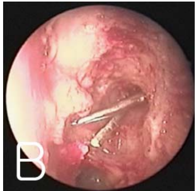
Figure 2. Photographs that shows scissoring motion of two probes. (A) External view. (B) Intranasal view.